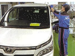
校外就業体験 (自動車整備補助)