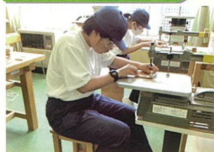
作業学習 (木材加工班)

校内での 作業学習 や、実際の会社で働かせていただく 校外就業体験 を通して、就労に必要な力の習得に向け、取り組んでいます。