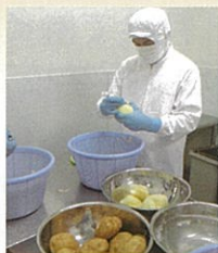
作業学習 (食品加工班)