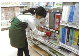
校外就業体験 (バックヤード業務)