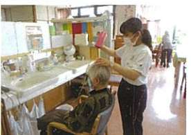
校外就業体験 (福祉施設業務)